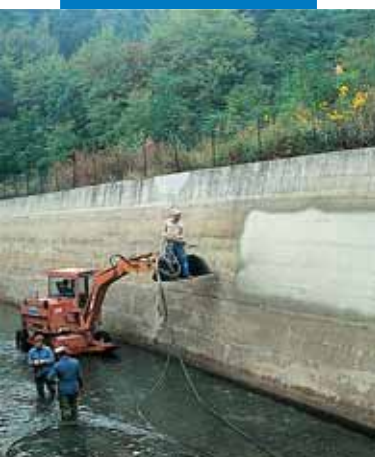
Нанесение Idrosilex Pronto напылением на подводящий канал гидроэлектростанции