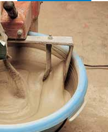
Смешивание серого Idrosilex Pronto с водой