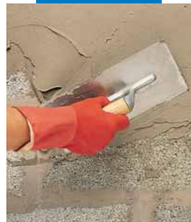
Нанесение Idrosilex Pronto мастерком