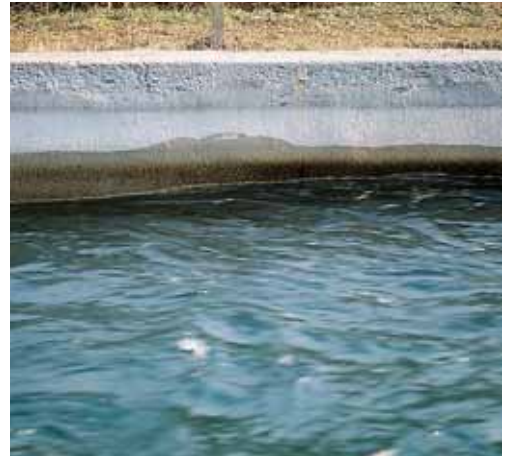
Подводящий канал ГЭС в г. Бертини – Робьяте (Область Комо) с поверхностью, обработанной Idrosilex Pronto

Любое воспроизведение или перепечатка части или целых текстов, фотографий или иллюстраций, опубликованных здесь, не разрешается и преследуется в соответствии с действующими законодательствами.