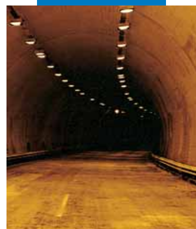
Нанесение белого Idrosilex Pronto напылением в автодорожной галерее