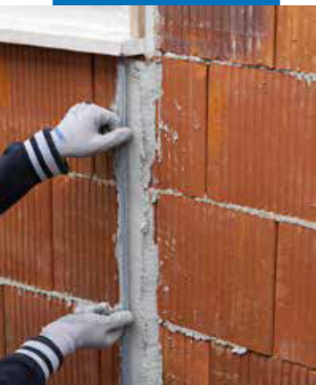
Установка вертикальных направляющих маяков