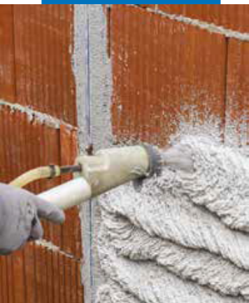
Нанесение Intomar 535 с помощью штукатурной станции