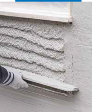
Выравнивание Intomar 535